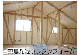
現場発泡ウレタンフォーム

構造：木造在来工法 仕様：高気密・高断熱仕様 規模：2階建て/約44坪 工期：約10か月(外構迄)