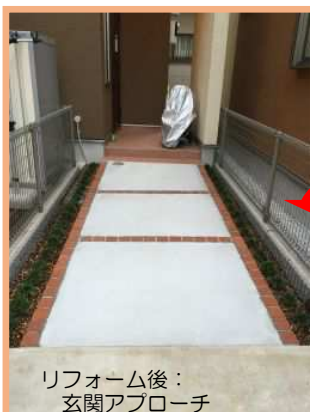
リフォーム後： 玄関アプローチ