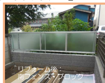
リフォーム後： 南フェンス・ブロック