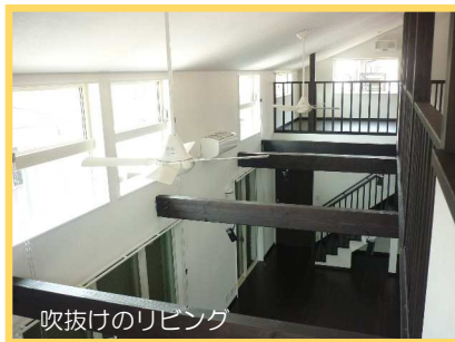
吹抜けのリビング